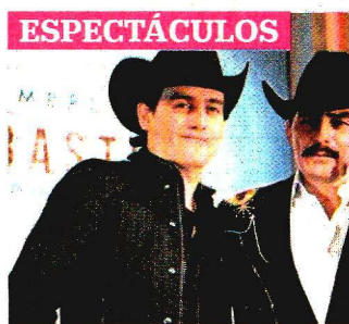
IRVIN OLIVARES, EL UNIVERSAL