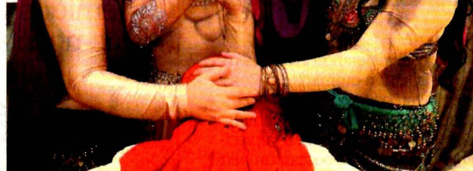
ESPECTÁCULOS POLÍTICA CON HUMOR El colectivo teatral de cabaret Las Reinas Chulas celebra 20 años con diversión y crítica. E1