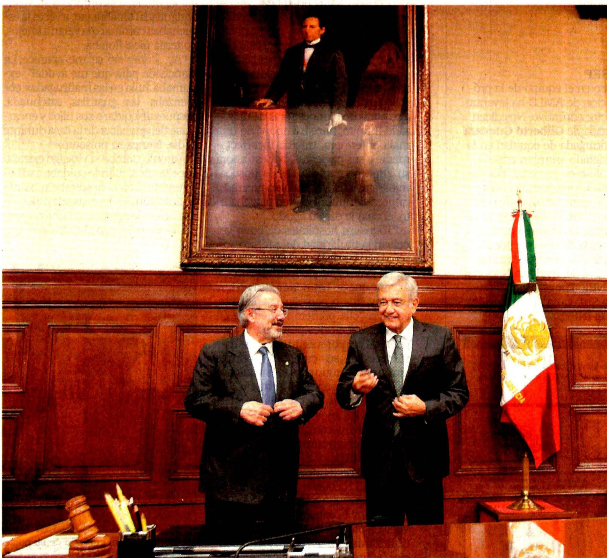
El ministro presidente de la Corte, Luis María Aguilar, y el presidente electo, Andrés Manuel López Obrador.