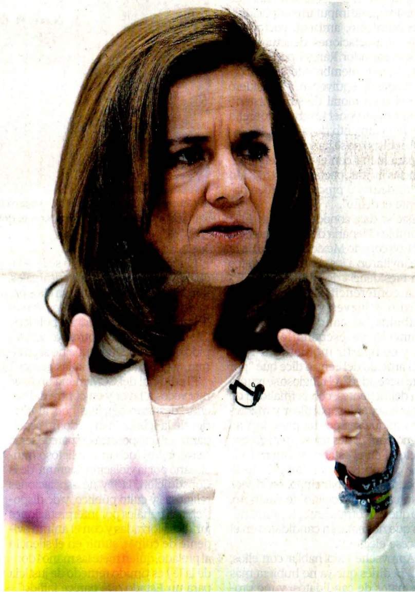
Margarita Zavala participó en un foro de EL UNIVERSAL, donde respondió preguntas de columnistas y articulistas de El Gran Diario de México.

● Participa Margarita Zavala en foro de EL UNIVERSAL ● Rechaza amnistía a delincuentes y se dice a favor del aeropuerto