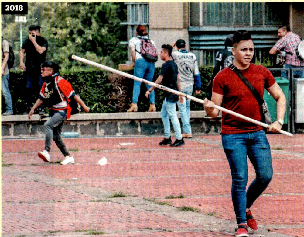
El 3 de septiembre pasado, porros atacaron con piedras y palos a estudiantes del CCH Azcapotzalco que se manifestaban en la explanada de Rectoría en Ciudad Universitaria.

La agresión del lunes pasado en Ciudad Universitaria fue similar a la del 10 de junio de 1971. Ese día, los llamados Halcones arremetieron con palos contra los estudiantes, mientras que el 3 de septiembre hicieron lo mismo grupos porriles, de quienes ayer se insistió su salida de la UNAM en una asamblea en la que participó la CNTE y ejidatarios de San Salvador Atenco y de San Quintín.