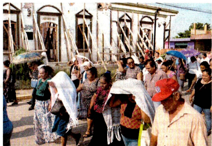
En Asunción Ixtaltepec, Oaxaca, damnificados de 14 municipios protestaron por la falta de apoyo a más de 62 mil personas afectadas.