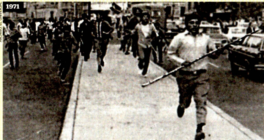
El 10 de junio de ese año, los Halcones atacaron con varas de bambú y otate a una movilización de estudiantes que avanzaba por la calle Instituto Técnico Industrial y la calzada México-Tacuba.