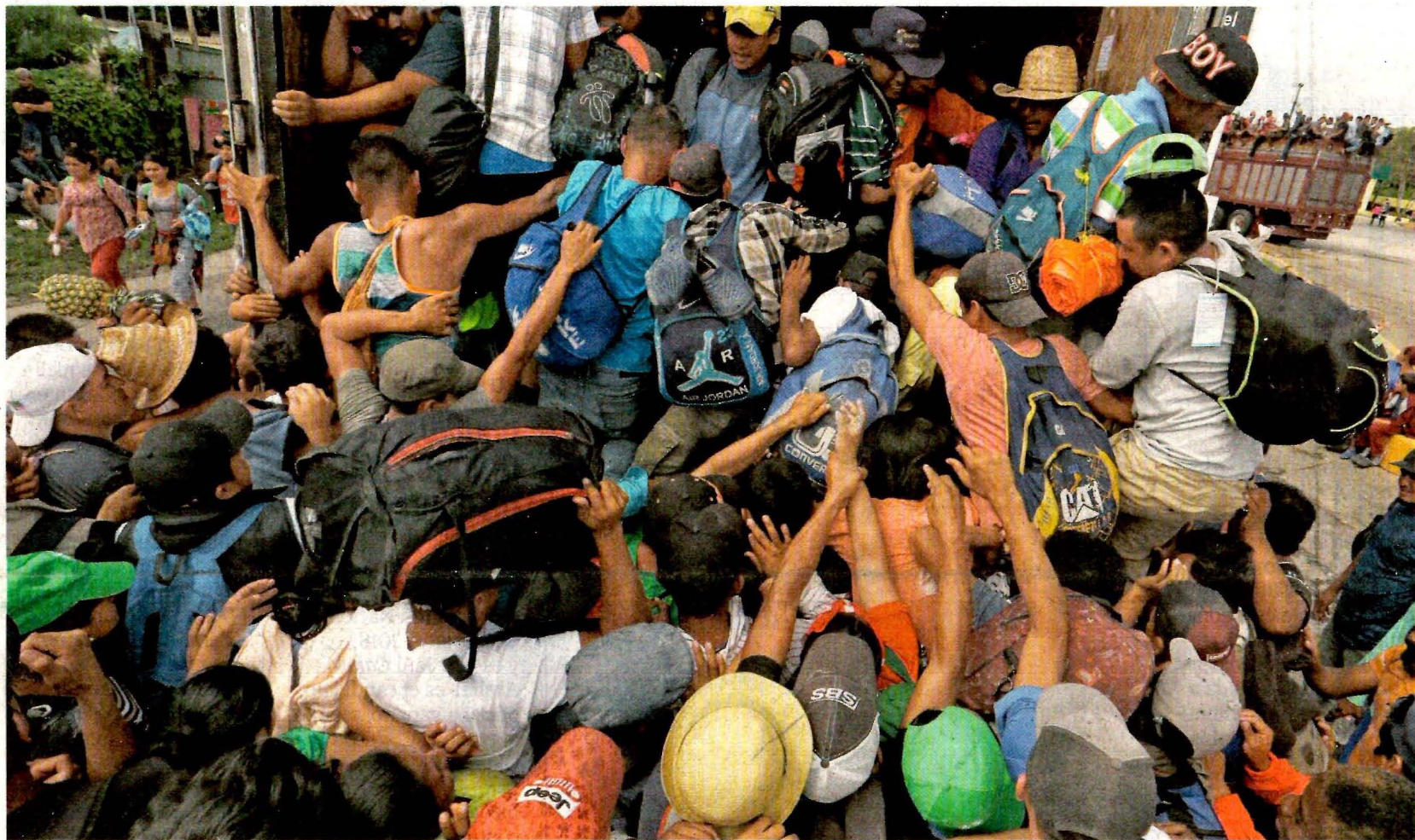
Ante la falta del transporte prometido por el gobierno de Veracruz para su traslado a la Ciudad de México, migrantes se aglutinan para aprovechar un aventón.

● Migrantes no logran un plan; se dividen por nacionalidades ● ONU critica: se perdió el rastro de parte de los viajantes