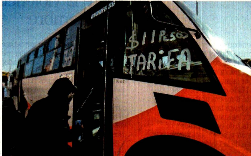
En la zona metropolitana de Querétaro la tarifa del transporte urbano subió de 8.50 a 11 pesos, mientras que en San Juan del Río pasó de 7.50 a 10 pesos.

En Tabasco, el ex gobernador Arturo Núñez autorizó, días antes de terminar su mandato, un aumento al transporte, que pasó de 8.50 pesos a 10, y el suburbano a 11 pesos, mientras que en la zona metropolitana de Querétaro desde el pasado 26 de diciembre el pasaje subió de 8.50 a 11 pesos y de 7.50 a 10 pesos en el municipio de San Juan del Río.