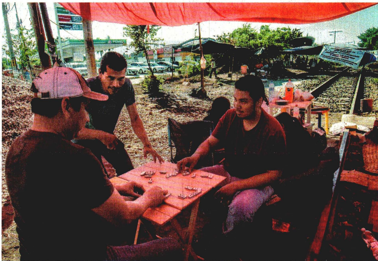
Las negociaciones de la CNTE sobre el bloqueo a las vías del tren en Michoacán permanecen estancadas. Mientras no se llega a un acuerdo, algunos maestros de la Sección 18 juegan dominó para matar el tiempo.

TERESA MORENO —estados@eluniversal.com.mx