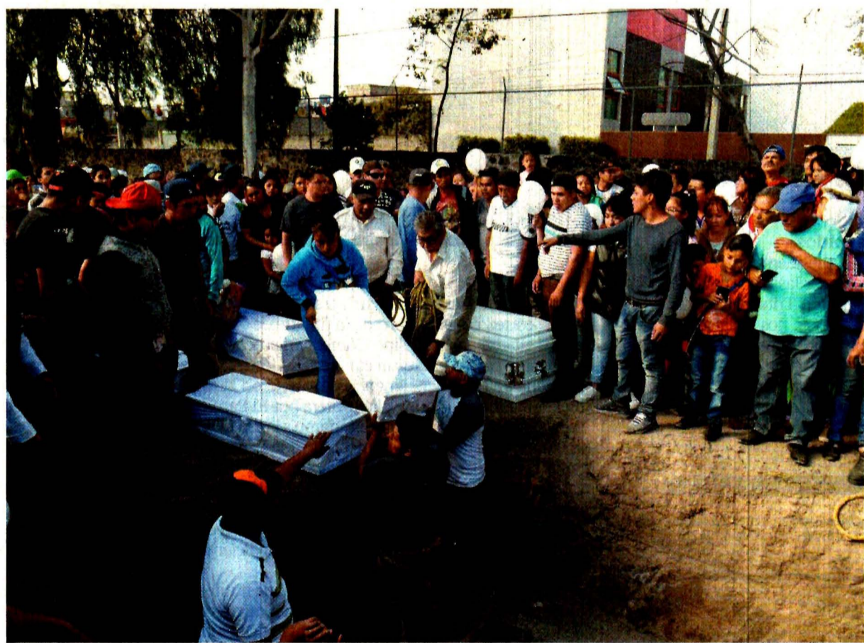
Los cuerpos de los siete niños que murieron el pasado viernes fueron sepultados ayer en el panteón de Santa Cruz.