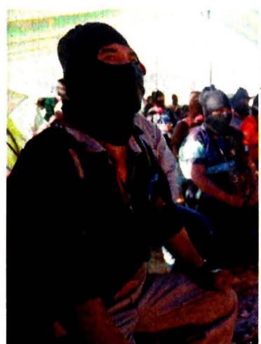
Chiapas, antes del aniversario del levantamiento zapatista de 1994.