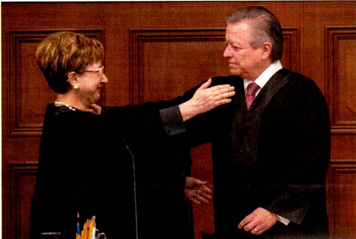
La ministra Margarita Luna Ramos tomó protesta a Arturo Zaldívar como presidente de la Suprema Corte de Justicia de la Nación, quien en su discurso se pronunció por la renovación del Poder Judicial y mantener la unidad.