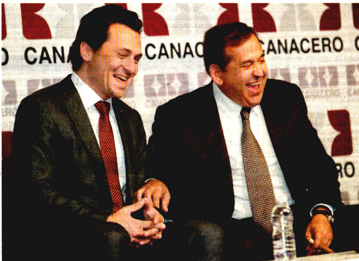
Emilio Lozoya Austin, exdirector de Pemex, y Alonso Ancira, presidente de Altos Hornos de México, son requeridos por la justicia mexicana debido a presuntos actos de corrupción.

Entre los señalamientos contra Ancira está la supuesta venta irregular que AHMSA realizó a Pemex, entonces encabezada por Lozoya, de una planta de Agronitrogenados que se