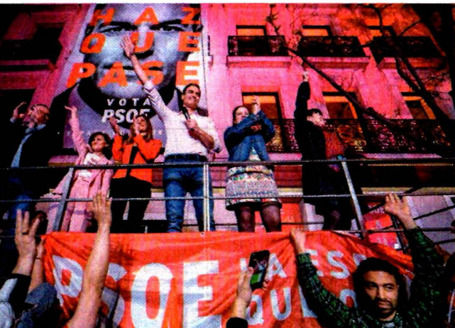
BERNAT ARMANQUE, AP