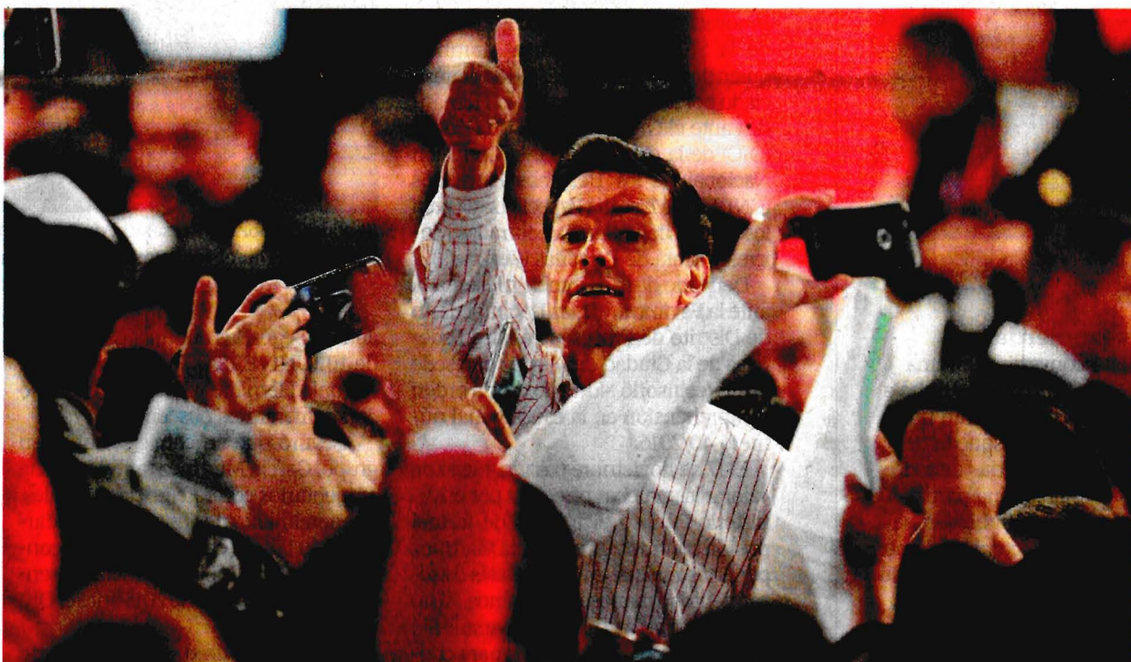
El presidente Enrique Peña Nieto asistió ayer a la sede del PRI para la renovación del Consejo Político del partido.

En la sede del tricolor, también pidió al PRI no tolerar actos de corrupción, que les han costado perder gubernaturas, y celebró la decisión de expulsar a quienes se vinculan con estos hechos. Sin embargo, el Presidente se pronunció en contra de