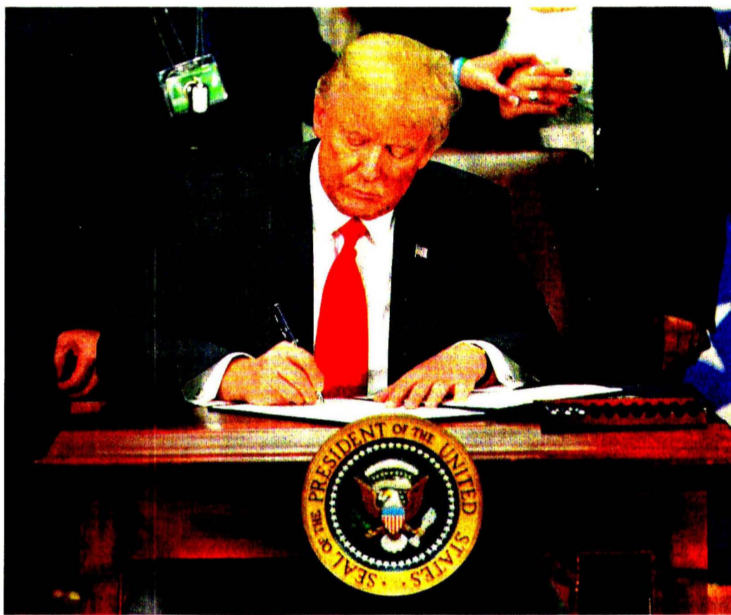
El presidente Donald Trump firmó ayer una orden ejecutiva para iniciar la construcción del muro en la frontera sur, reforzar seguridad en la franja y acabar con las ciudades santuario de migrantes.