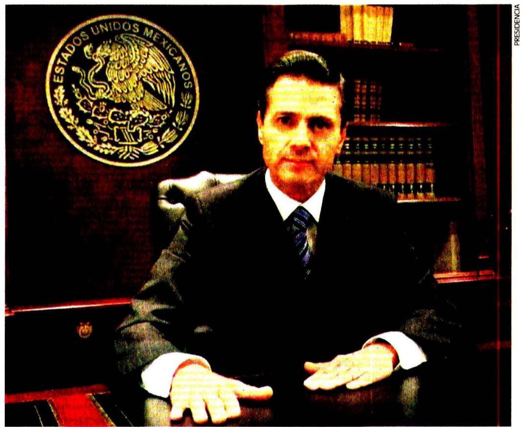
En un mensaje a la nación, el presidente Enrique Peña Nieto censuró la postura del gobierno de Estados Unidos de mantener la decisión de construir el muro en la frontera sur de ese país.

FRANCISCO RESÉNDIZ Y VÍCTOR SANCHO Reportero y Corresponsal —politica@eluniversal.com.mx