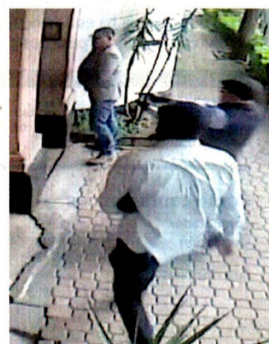
Cámaras de seguridad de la casa del cardenal captaron a los atacantes.