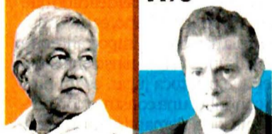
Andrés Manuel López Obrador Enrique Peña Nieto