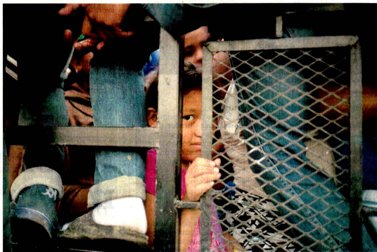
Uno de cada tres migrantes centroamericanos que integran la caravana es menor de edad, como la niña que aparece en la imagen, que viaja en la parte trasera de una camioneta en Huixtla, Chiapas.