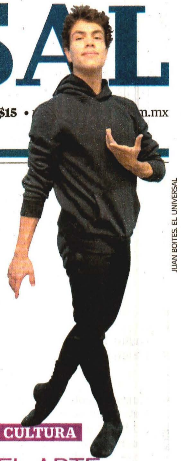
JUAN BOTES, EL UNIVERSAL