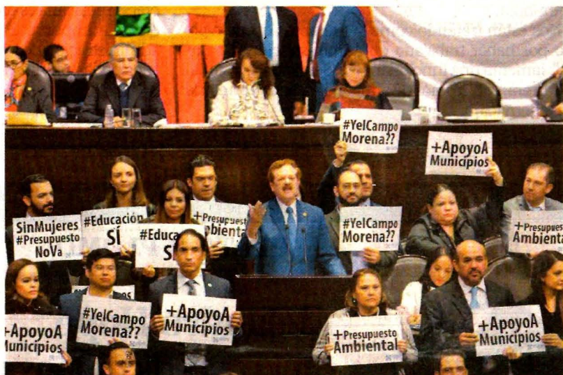
El grupo parlamentario del PAN protestó durante la discusión del presupuesto, que finalmente se aprobó por 312 votos a favor y 154 en contra.