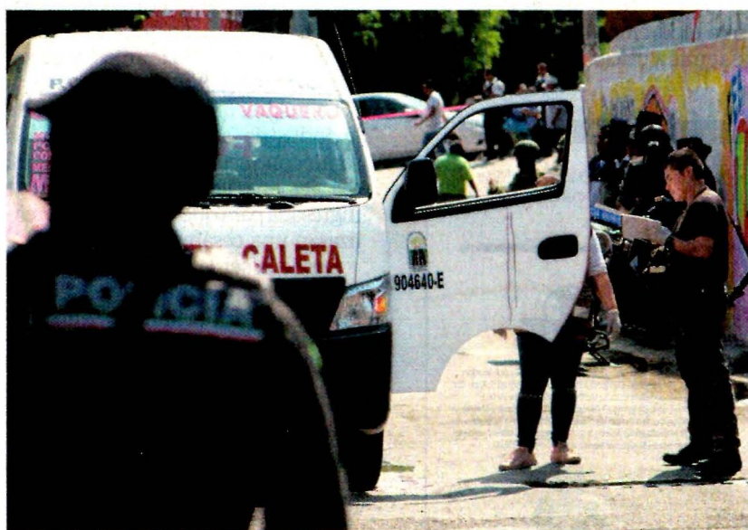
Desde hace más de una década comenzó el declive del puerto de Acapulco, que actualmente padece por la delincuencia y los cárteles de la droga.