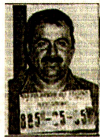
El alcalde de San Blas fue detenido en 2005 por posesión de arma de fuego.