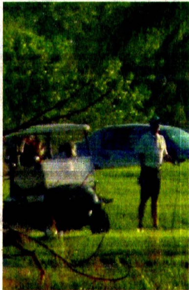
Corral Jurado pasó el fin de semana en Sinaloa, donde jugó golf.

Los datos obtenidos muestran que Corral llegó a Mazatlán en una avioneta Cessna.