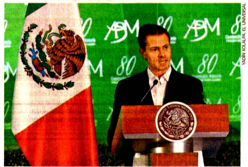
Ante banqueros, el Presidente expuso que la ruta para superar los retos de un país es asegurando las condiciones para el desarrollo de las personas.

Al inaugurar la 80 Convención Bancaria, el presidente Enrique Peña Nieto criticó al populismo, que ofrece "soluciones aparentemente fáciles y mágicas, que cierran espacios de libertad y participación ciudadana". Advirtió que ante la incertidumbre económica y la creciente desigualdad hay riesgo de que las sociedades opten por esta "salida ilusoria".