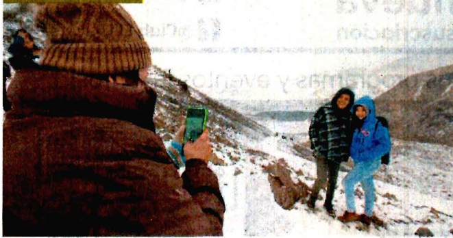
JORGE ALVARADO, EL UNIVERSAL