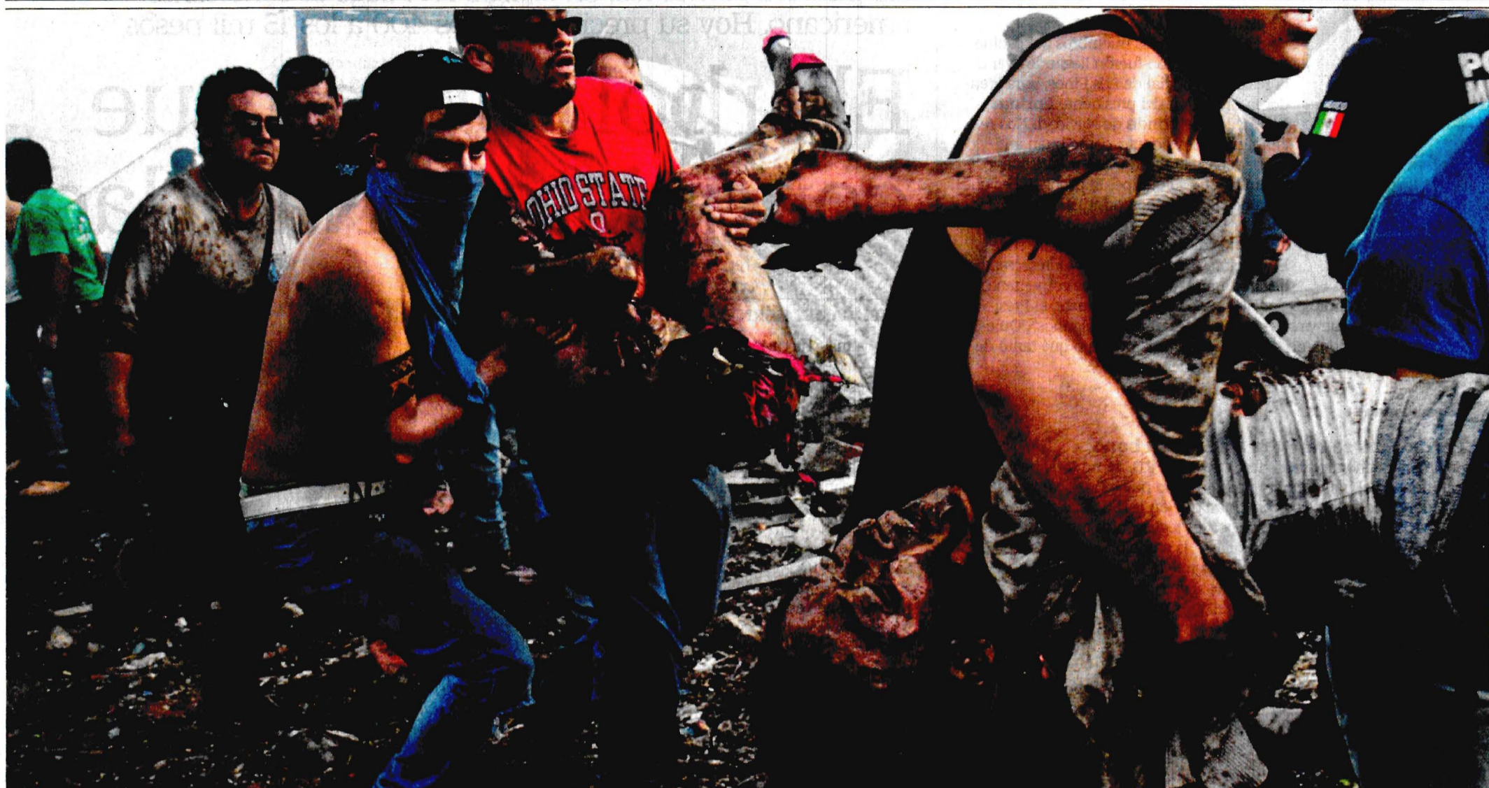
Imágenes muestran la gravedad del daño causado por la nueva explosión en Tultepec, municipio mexiquense en el que recurrentemente suceden este tipo de tragedias que siembran muerte y dolor.