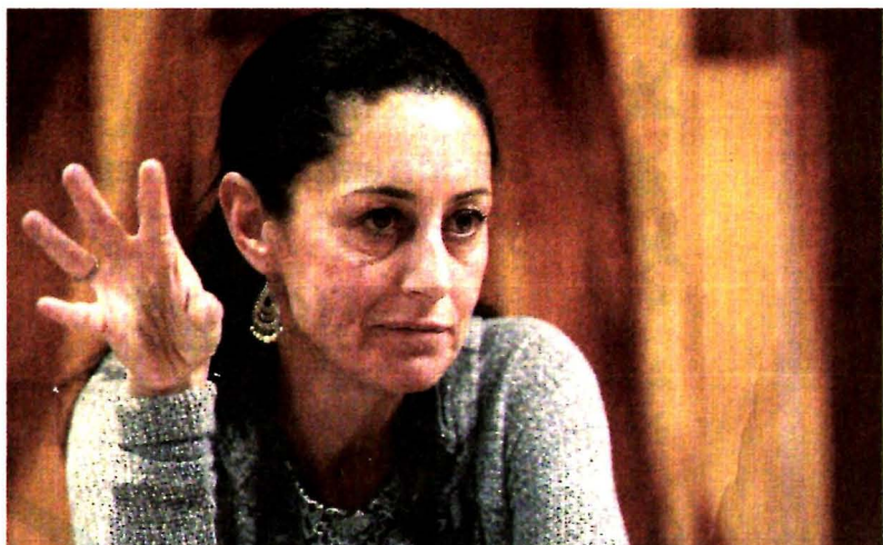
La delegada considera que es difícil que se dé una alianza Morena-PRD.

● Tiene Barrales departamento de 14 mdp en Miami. A6