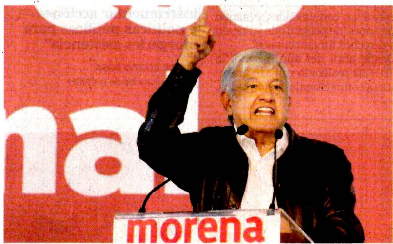
López Obrador lanzó la advertencia en el Congreso Nacional de Morena.

Les pidió dejar de lado la corrupción, el amiguismo, el nepotismo y