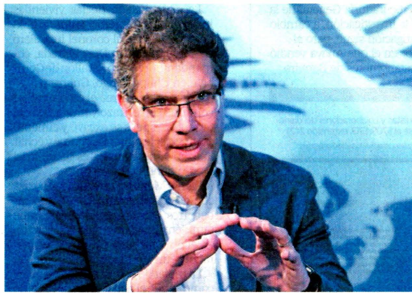
El aspirante a la candidatura presidencial critica al INE por revisión de firmas.