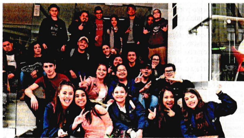
Los jóvenes connacionales son bilingües y cuentan con estudios universitarios.