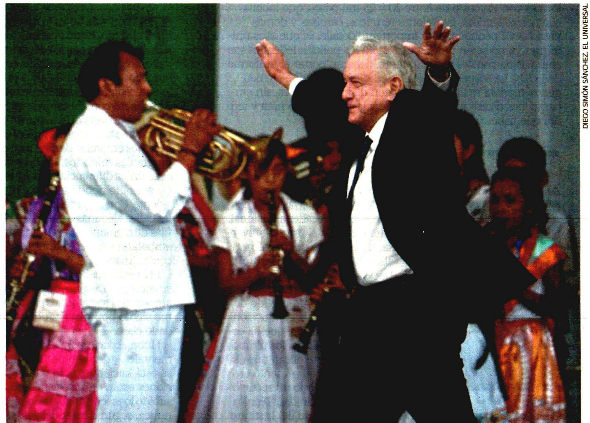
Andrés Manuel López Obrador rindió un informe de los primeros siete meses de la llamada 4T, en el que destacó que la austeridad y el combate al huachicol han significado ahorros por más de 187 mil millones de pesos.