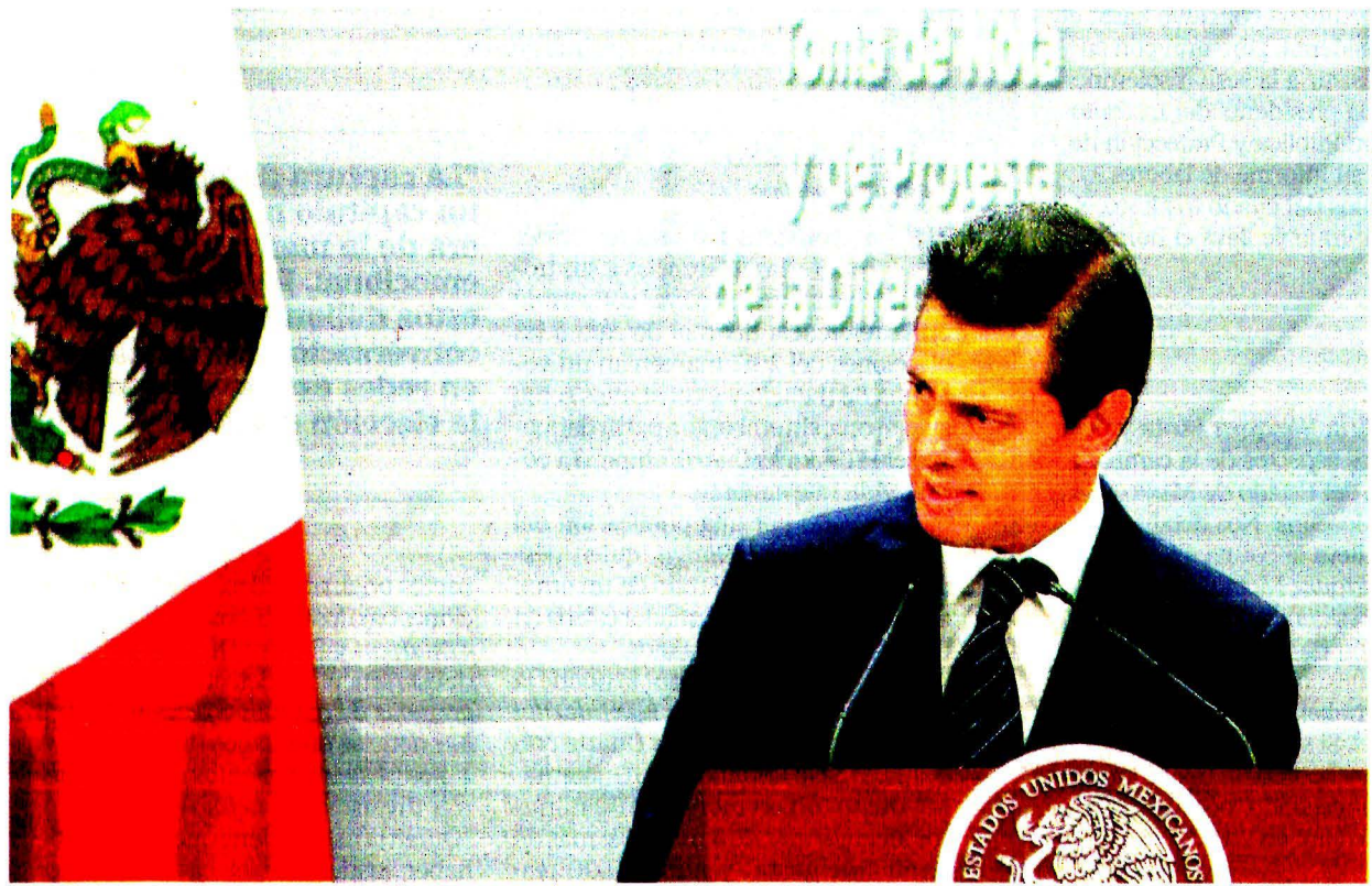
El presidente Enrique Peña Nieto dijo que quienes quebrantan la ley deben responder por sus actos.