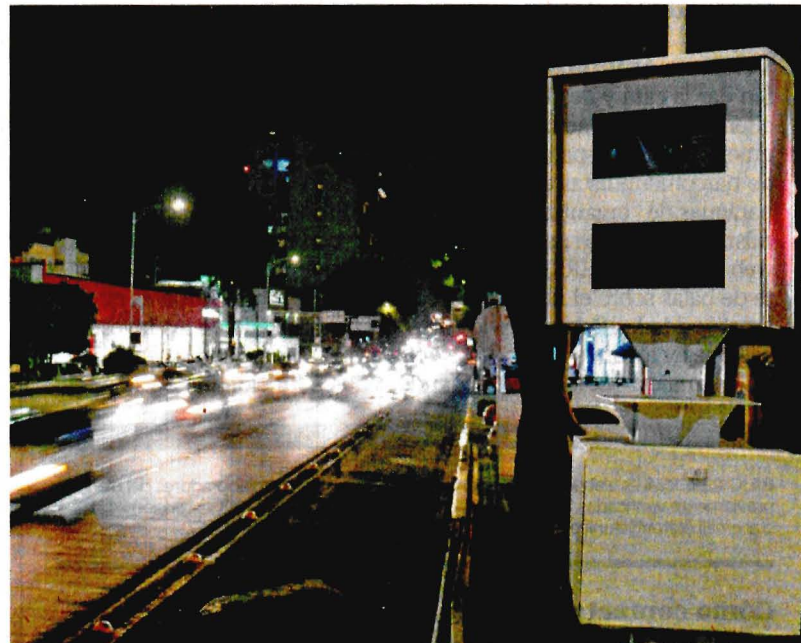
La mayoría de fotomultas fueron por no respetar la luz roja del semáforo; le siguieron dar vuelta prohibida e invasión de zona peatonal y de motocicletas.