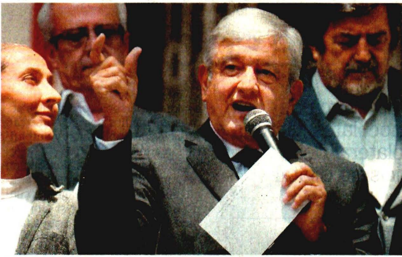
El presidente electo, Andrés Manuel López Obrador, dio a conocer ayer la ampliación del proyecto de tren turístico Maya.

porque la iniciativa es para que haya una política de austeridad de Estado y eso incluye a todos los servidores públicos de los tres poderes y no sólo reducir los sueldos de altos funcionarios, sino terminar con todos los