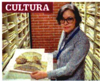
CULTURA DE CIENCIA Y OTRAS HIERBAS El MEXU, en la UNAM, es el herbario más grande de América Latina, con un millón 300 mil plantas. E7