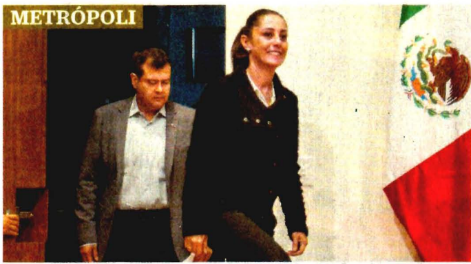
METRÓPOLI RECURSOS DE TRANSICIÓN PARA 19-S Claudia Sheinbaum, jefa de Gobierno electa, entregará dinero para estudios en zonas afectadas por el sismo. C3