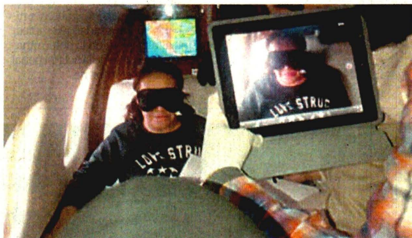
IMAGEN INÉDITA. La ex dirigente del SNTE, al ser detenida en 2013, a bordo de un avión privado. Columna Historias de Reportero NACIÓN A6