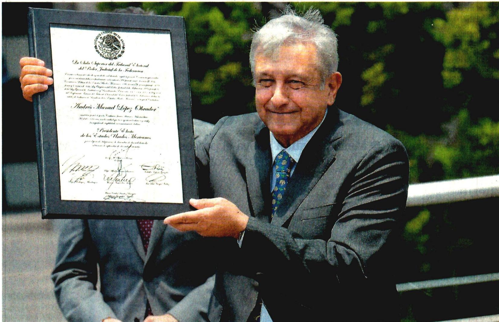
Andrés Manuel López Obrador muestra su constancia de mayoría, que lo acredita como presidente electo de México.