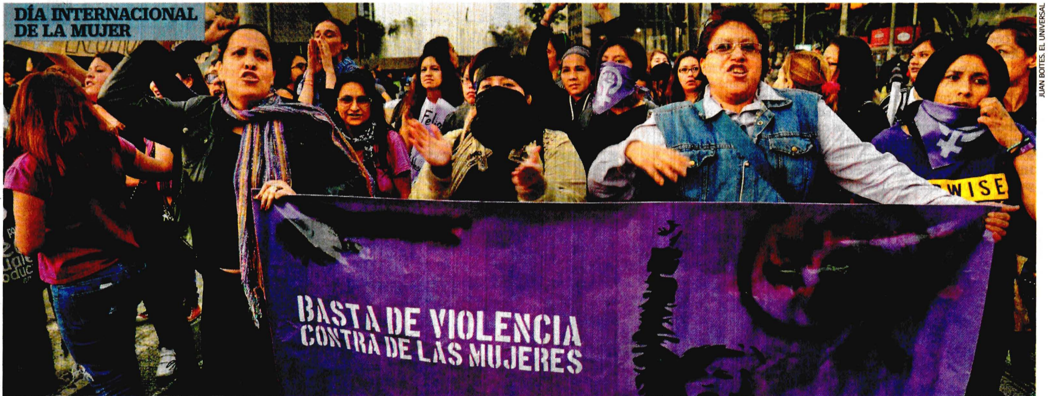
Las manifestantes marcharon durante más de dos horas sobre Paseo de la Reforma; denunciaron la falta de atención de las autoridades y la impunidad en los casos de violencia contra las mujeres.