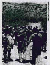
Se enfrentan a resacas, espantos de coyotes y a morir en el desierto.

● Ven voluntad divina en desaparición de río Atzac. A16