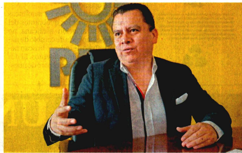
El líder del PRD dice que su labor no ha sido de escritorio, sino de territorio.

rrrota, sino como una oportunidad para refundar el partido a través de un cambio generacional y, de ser necesario, hasta cambiar de nombre.