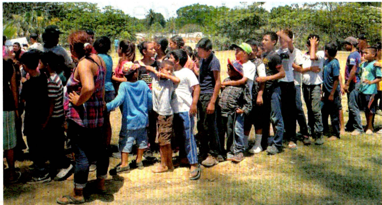
Migrantes centroamericanos permanecen en el Centro Deportivo Ferrocarrilero Víctor F. Morales en Matías Romero, Oaxaca, en su travesía por México en busca de llegar a la frontera con Estados Unidos.

El Alto Comisionado de las Naciones Unidas para los Refugiados detalló que en 2016 Estados Unidos admitió a un total de 85 mil personas que pidieron refugio.