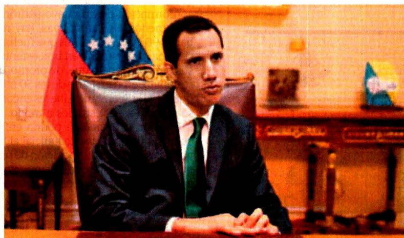
El opositor Juan Guaidó afirma que seguirá la lucha por la libertad de Venezuela.