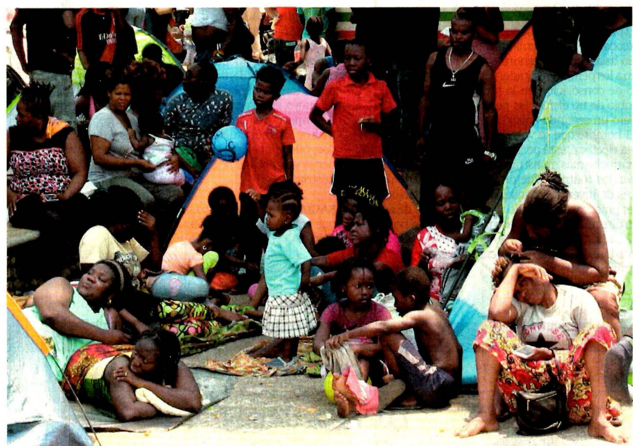
Migrantes de diversas nacionalidades permanecen afuera de la Estación Migratoria Siglo XXI en Tapachula, Chiapas, a la espera de que las autoridades mexicanas decidan su situación.