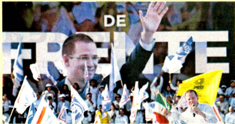
En San Juan de los Lagos, Jalisco, Anaya dijo que la seguridad es su prioridad.