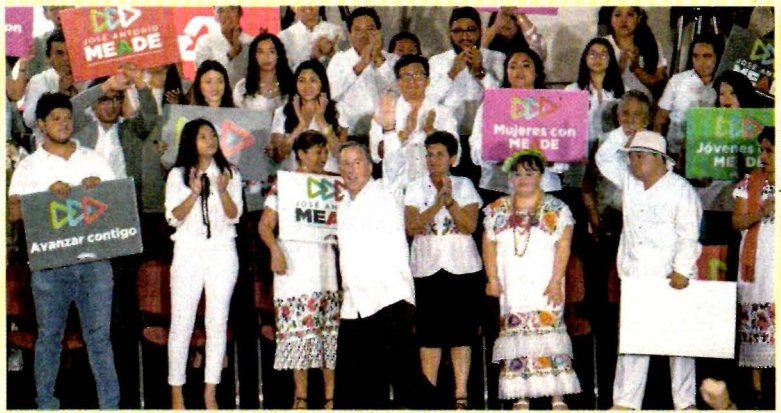
Los mexicanos estamos hartos de la corrupción, dice Meade en Mérida.