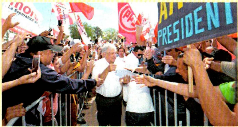
En Ciudad Juárez, Chihuahua, AMLO lanzó un mensaje a Donald Trump.