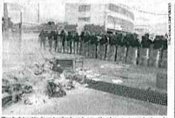
Tres la detención de un magistrado en la agresión a los maestros, miembros de una organización social destruyeron la escuela y robaron a una abanderada.