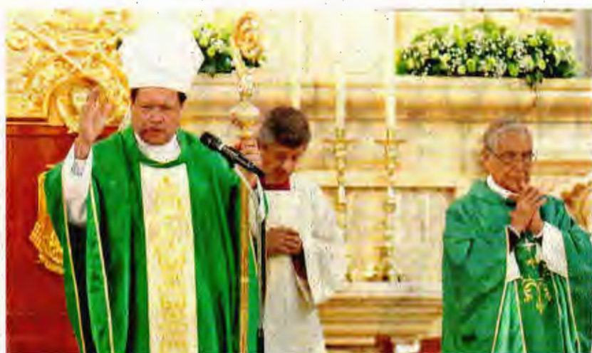
El cardenal Norberto Rivera dijo que en la reconstrucción del país los mexicanos deben trabajar unidos, sin confrontación ni división.