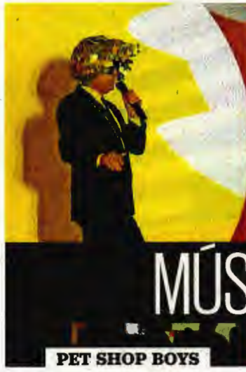
PET SHOP BOYS