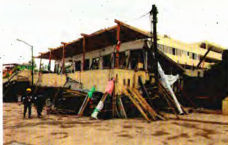
El departamento tenía materiales como granito y porcelanato, y una bañera.

● De 2006 a la fecha se han presentado ante la Procuraduría General de la República más de 800 denuncias por tortura cometida por servidores públicos, en un patrón cuyo común denominador es la impunidad, denuncian especialistas y ONG. A16