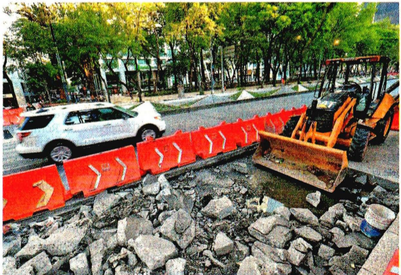
Sobre el Paseo de la Reforma los trabajos del carril confinado del Metrobús están detenidos y la maquinaria se encuentra parada.