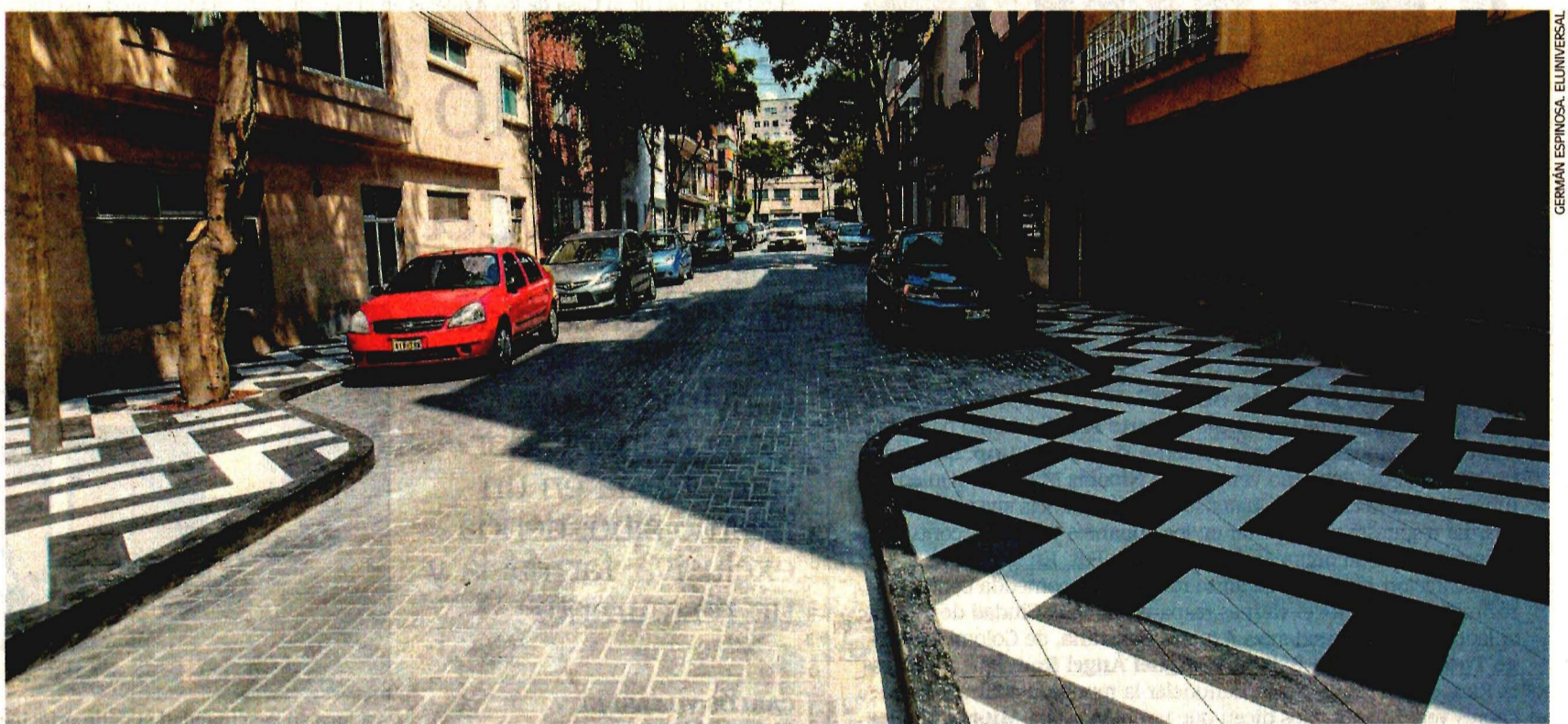
Sin baches, indigentes ni ambulantes es como luce ahora la calle Biarritz, cuyas banquetas marcan el prototipo artesanal que se replicará en otras 14 calles.

CDMX, SIN PERMISOS PARA METROBUS DE REFORMA. METRÓPOLI C1