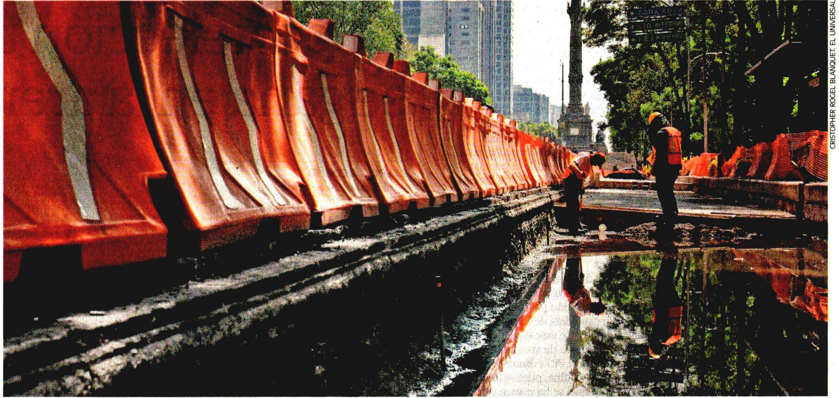
CRISTOPHER ROCEL BLANQUET/EL UNIVERSAL

Un juez federal ordenó el cese total e inmediato de la construcción de la Línea 7 del Metrobús en Reforma, tras otorgar una suspensión definitiva a un amparo promovido por la Academia Mexicana de Derecho Ambiental. El motivo, proteger la zona del Bosque de Chapultepec y monumentos. El gobierno de la CDMX impugnará la decisión y aseguró que las obras continuarán porque no dañan las áreas que se piden proteger. C1