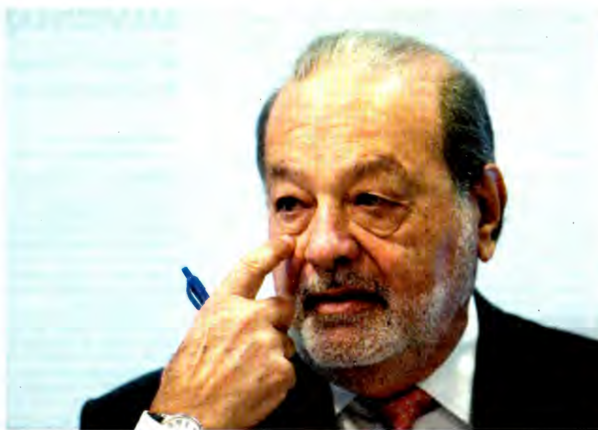
El magnate Carlos Slim explicó que los esfuerzos de reconstrucción se enfocarán en cinco objetivos: ayuda humanitaria, patrimonio cultural, centros de salud y escuelas, vivienda y mercados.