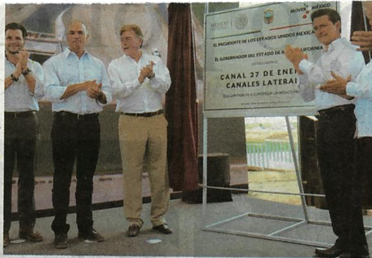
En Baja California, el Primer Mandatario entregó obras de infraestructura hidráulica sin precedentes

“En 2014, con el apoyo decidido del Gobierno mexicano y bajo el liderazgo de nuestro Presidente, se coordinó con el Gobierno de Estados Unidos poner en marcha un proyecto ambiental sin precedentes. Ello para poder recuperar la reserva de la biosfera del Delta del Río Colorado, siendo la primera vez que se liberó agua para fines ambientales. Con esto, lo que estamos asegurando es el bienestar de la sociedad en su conjunto”, subrayó.