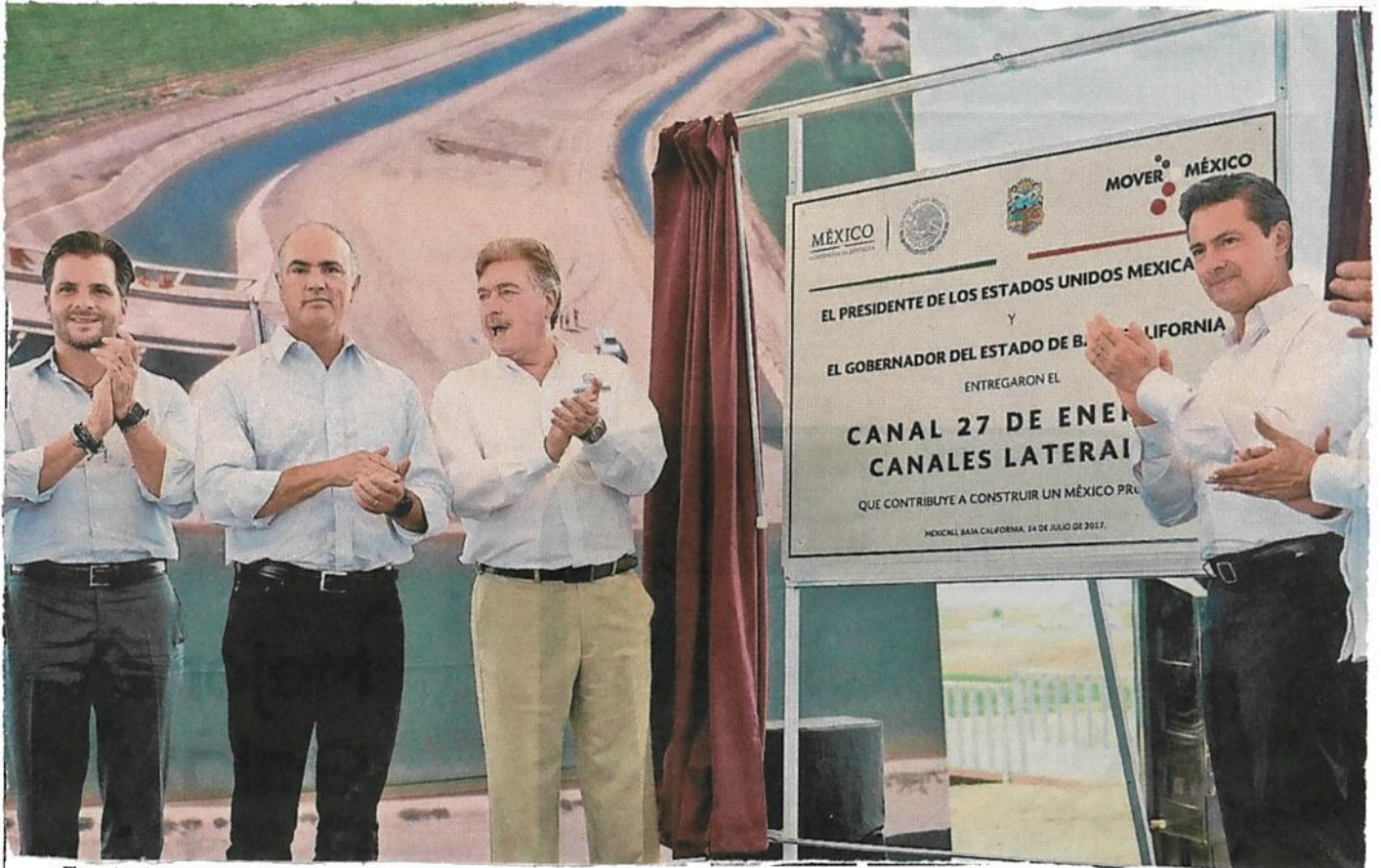
El presidente Enrique Peña Nieto acudió a Mexicali para inaugurar el Canal de Riego 27 de Enero, que dará servicio a unos 17 mil productores de la región.