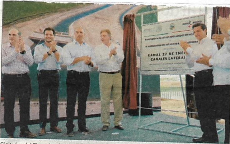
El titular del Ejecutivo federal entregó en el Valle de Mexicali el Canal de Riego 27 acompañado del gobernador de la entidad y de miembros de su gabinete.