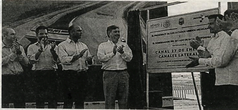
Otra obra más que va al banquillo de los acusados.

De acuerdo con información del Mañana, campesinos de Baja California dieron a conocer que la obra del Canal 27 de Enero que inauguró el presidente Enrique Peña Nieto ayer, tiene serias fallas, además de que en su construcción utilizaron materiales de mala calidad, por lo que califican esta obra como un fraude.