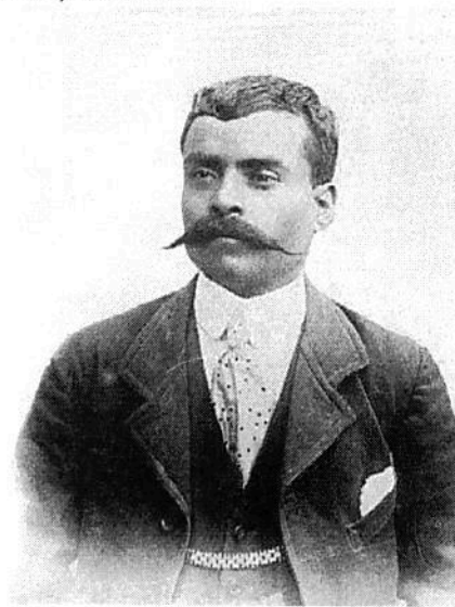
El motivo de la masiva movilización es la exigencia de que el capítulo agropecuario quede fuera de la renegociación del TLCAN. En la imagen, el caudillo del Sur.

Carolina Gómez Mena | lunes, 24 jul 2017 13:59