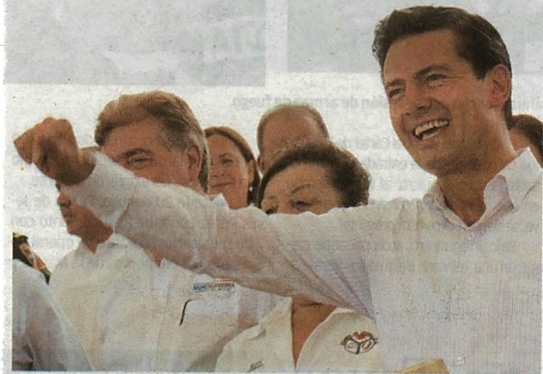
‘ARRANCAREMOS CON OPTIMISMO’ En obras hidráulicas entregadas se invirtieron 2 mil 895 millones de pesos, afirma el Ejecutivo federal