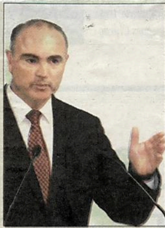
José Calzada, titular de la Sagarpa.