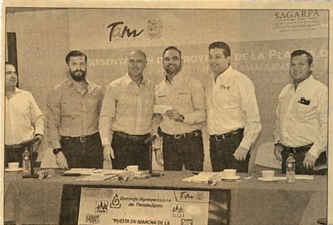
El mandatario del estado señaló que este tipo de desarrollo contribuye a la modernización del país.

El proyecto tendrá capacidad de producir hasta 350,000 litros diarios