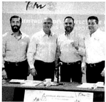
El gobernador destacó que el proyecto tardó 10 años en iniciar.

En este marco, el gobernador y el titular de la Sagarpa entregaron estímulos por 75 millones de pesos, que permitirán iniciar la construcción de las instalaciones de dicha planta.