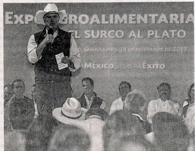
José Calzada Rovirosa, titular de la SAGARPA

Nos hemos convertido en el décimo segundo productor de alimentos, y en el décimo exportador, por eso tenemos muchas cosas, de las cuales hablar y que presumir, principalmente de nuestra gente que se esfuerza y que trabaja".