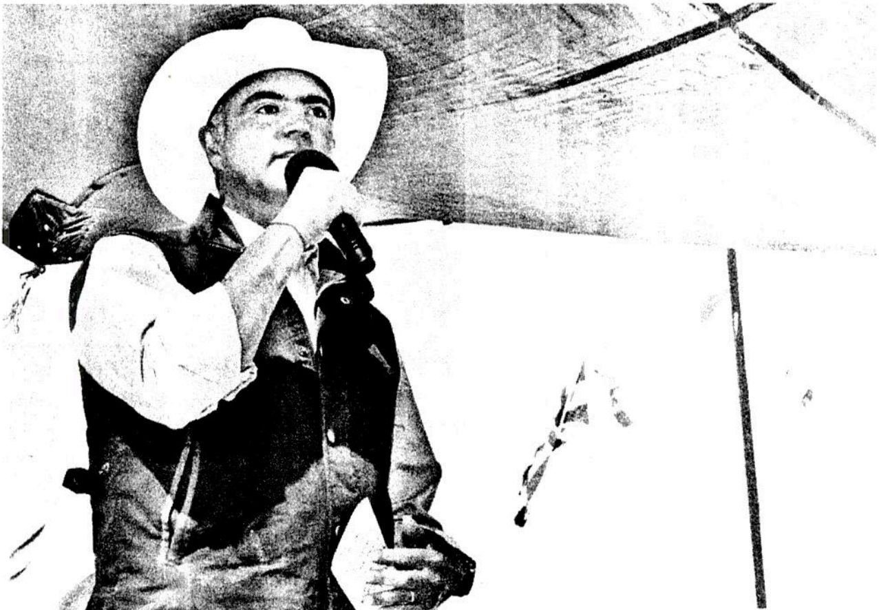
JOSÉ CALZADA Rovirosa fijó su postura durante su visita a Irapuato, en el marco de la inauguración de la edición número 22 de la Expo Agroalimentaria

■ 13 millones de toneladas de maíz al año