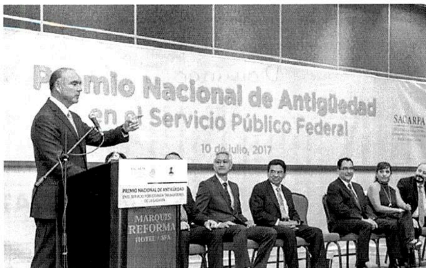
Reconoce la Sagarpa trayectoria laboral de sus trabajadores

Ciudad de México. – Como parte del Premio Nacional de Antigüedad en el Servicio Público Federal (SPF), el titular de la Secretaría de Agricultura, Ganadería, Desarrollo Rural, Pesca y Alimentación (Sagarpa), José Calzada Rovirosa, entregó reconocimientos a trabajadores de la dependencia por 15, 20, 25, 30, 40 y 50 años de trabajo.