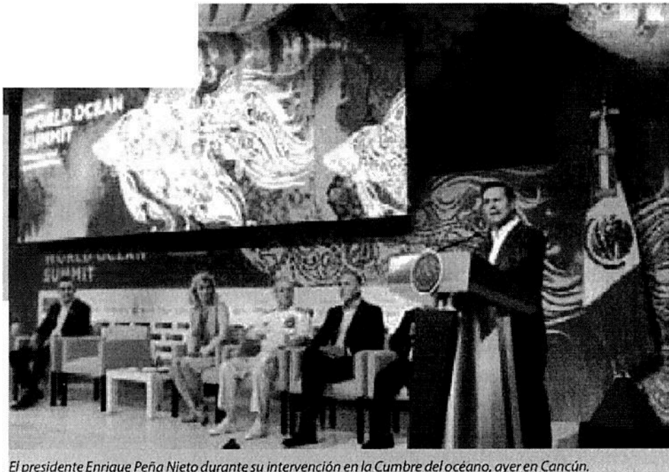
El presidente Enrique Peña Nieto durante su intervención en la Cumbre del océano, ayer en Cancún.