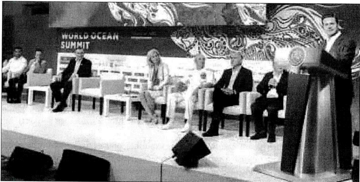
Enrique Peña Nieto encabezó en la Riviera Maya la inauguración de la Cumbre Mundial del Océano 2018.