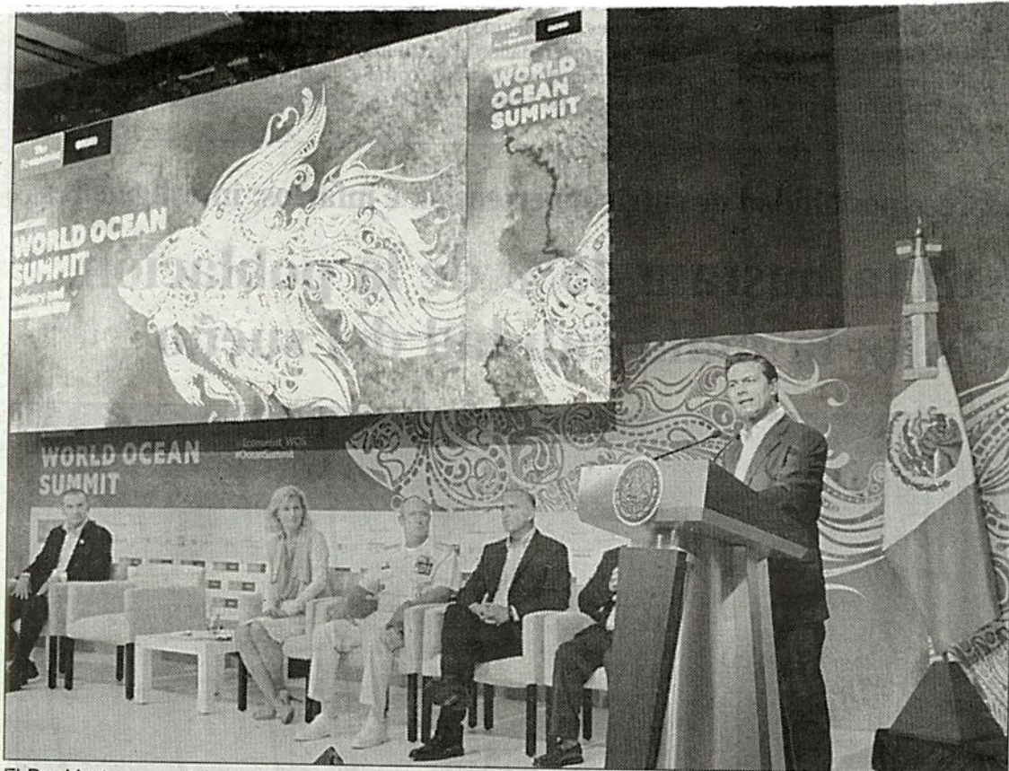
El Presidente se mostró orgulloso de que el Parque Nacional del Archipiélago Revillagigedo sea hoy la mayor área marina protegida en América del Norte

■ En Cumbre Mundial del Océano, el mandatario llamó a ser audaces en conservación de los mares