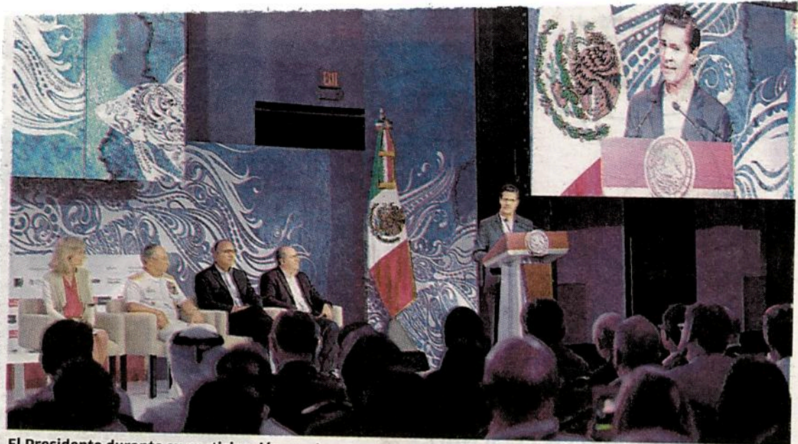
El Presidente durante su participación en el encuentro que congregó a académicos y líderes sociales.

El mandatario resaltó los esfuerzos de México por conservar especies como la vaquita marina