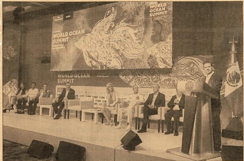
En México se busca potencializar los mares y costas.

aprovechar el potencial de los océanos, mares y costas, manteniendo el equilibrio entre el crecimiento económico, la seguridad alimentaria y la conservación de los ecosistemas.