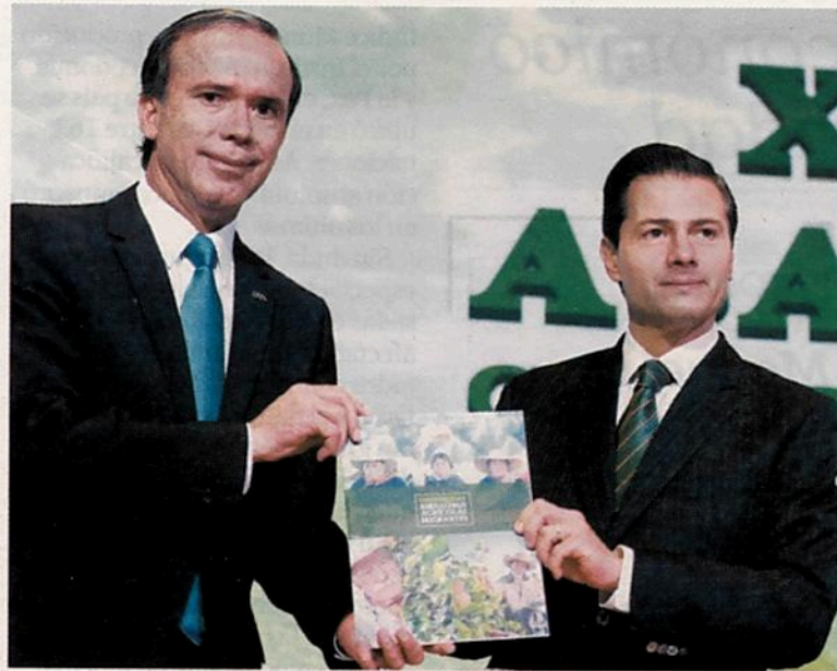
BOSCO Y PEÑA. En la exportación de alimentos, México es el décimo lugar mundial.

ocurrido en los últimos tres años, a partir de 2015, 2016, 2017, y estoy seguro que en 2018 habrá de confirmar esta capacidad productiva de nuestro país”, agregó el Presidente.