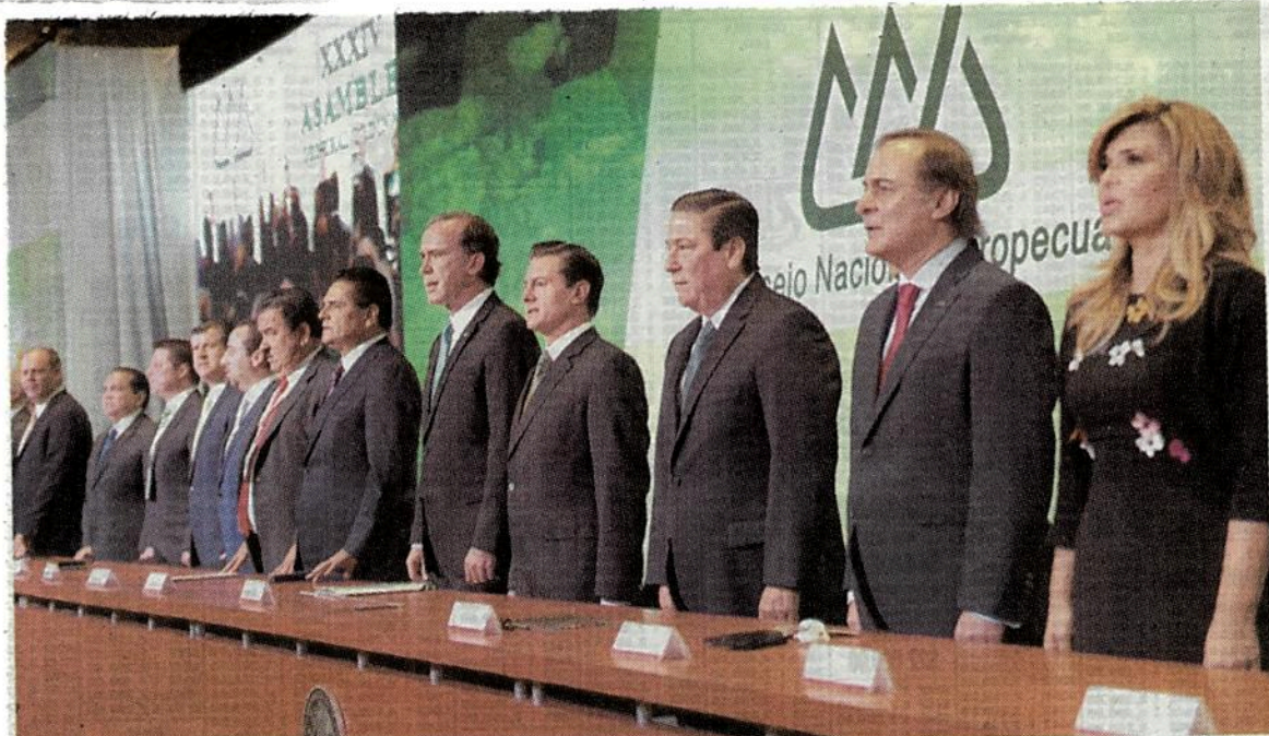
Ejecutivo federal encabeza la Clausura de la 34 Asamblea del Consejo Nacional Agropecuario

Explicó que este esfuerzo asegurará una mejor calidad de vida a los 2.5 millones de jornaleros y nueve millones de personas contando a sus familias, al darles mayor atención, pues “son ciudadanos mexicanos y merecen oportunidades y una vida digna en cualquier parte de la geografía nacional”.