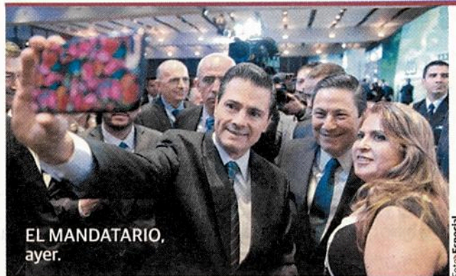
EL MANDATARIO, ayer.