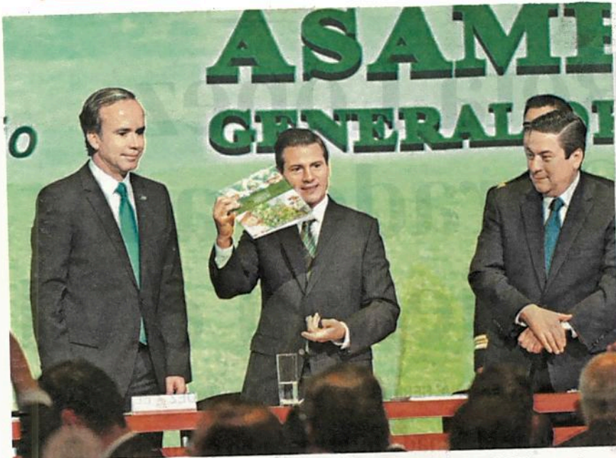
Enrique Peña Nieto entregó el Premio Nacional Agropecuario 2017