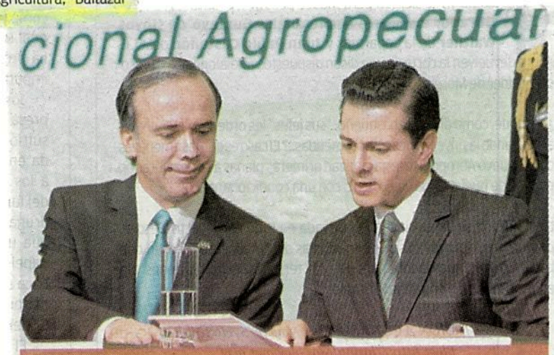
El Primer Mandatario firmó el convenio de la Estrategia de Atención a Jornaleros Agrícolas Migrantes

"México es ya el decimosegundo país que más alimentos produce en todo el mundo y el décimo octavo país que más