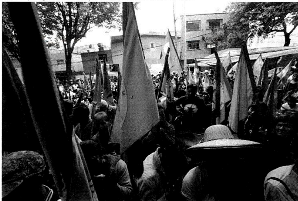
Campesinos bloquean instalaciones de Sagarpa en imagen de archivo.

Fabiola Martínez y Angélica Enciso | 📅 martes, 10 abr 2018 🕒 19:01