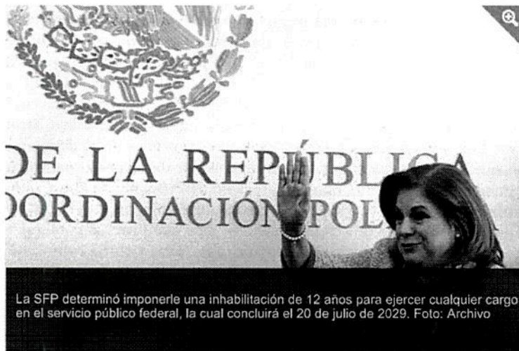
La SFP determinó imponerle una inhabilitación de 12 años para ejercer cualquier cargo en el servicio público federal, la cual concluirá el 20 de julio de 2029.