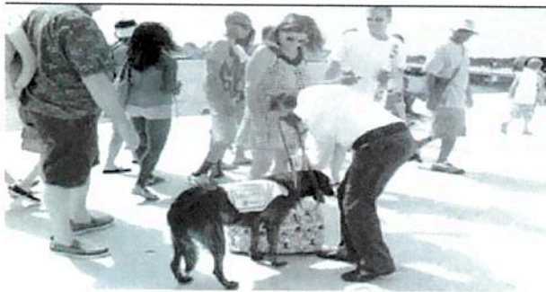
SAGARPA lleva inspección, como medida de precaución por el periodo vacacional de verano.

Los productos "prohibidos" son los alimentos de elaboración casera; alimentos o premios para mascotas con contenido de origen rumiante; harinas de origen animal; quesos frescos; carne de cerdo, ave, res, fresca, enlatada, refrigerada o congelada; crustáceos crudos o secos en cualquier presentación; tierra, plantas, flores, paja, heno o palma. Los productos "regulados" con permiso de acceso son los productos son cárnicos que provengan de plantas autorizadas por la SAGARPA; animales vivos; material vegetal propagativo (semillas, bulbos, esquejes, etc.); granos y cereales secos; flores cortadas y plantas; frutas y verduras frescas; vacunas o biológicos de alguna enfermedad que no existe en México; trofeos de caza y pieles no terminadas, sin curtir, etcétera.