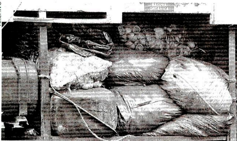
LAS DEPENDENCIAS gubernamentales señalaron que está pendiente determinar el impacto sobre la biodiversidad para diseñar sistemas alimentarios